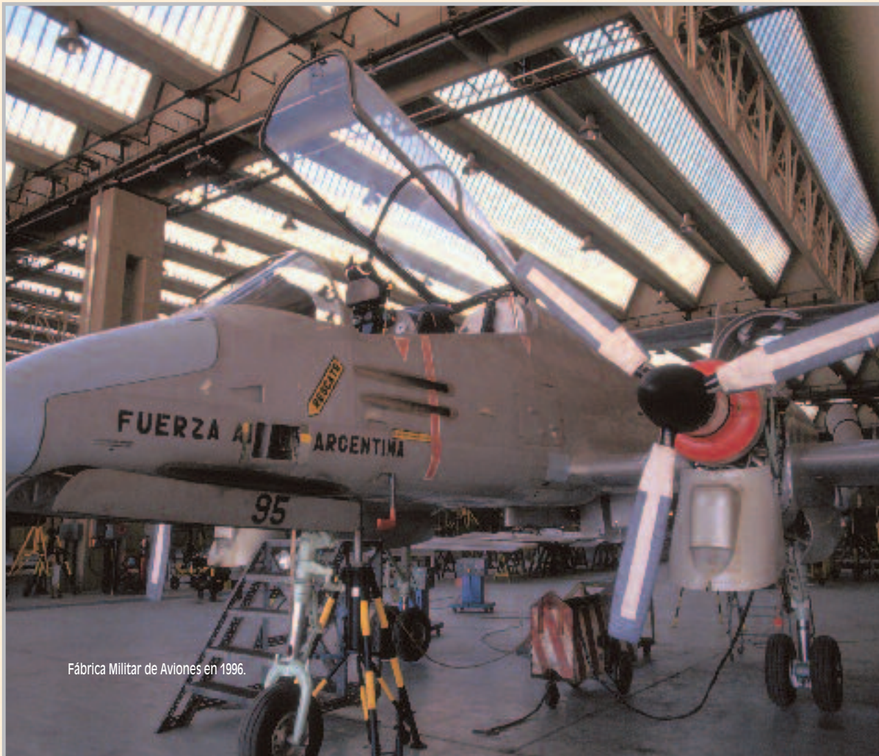
Fábrica Militar de Aviones en 1996.

- Dique Los Alazanes. Inaugurado por Del castillo, se encuentra oculto en lo más alto de las Sierras Chicas, cerca