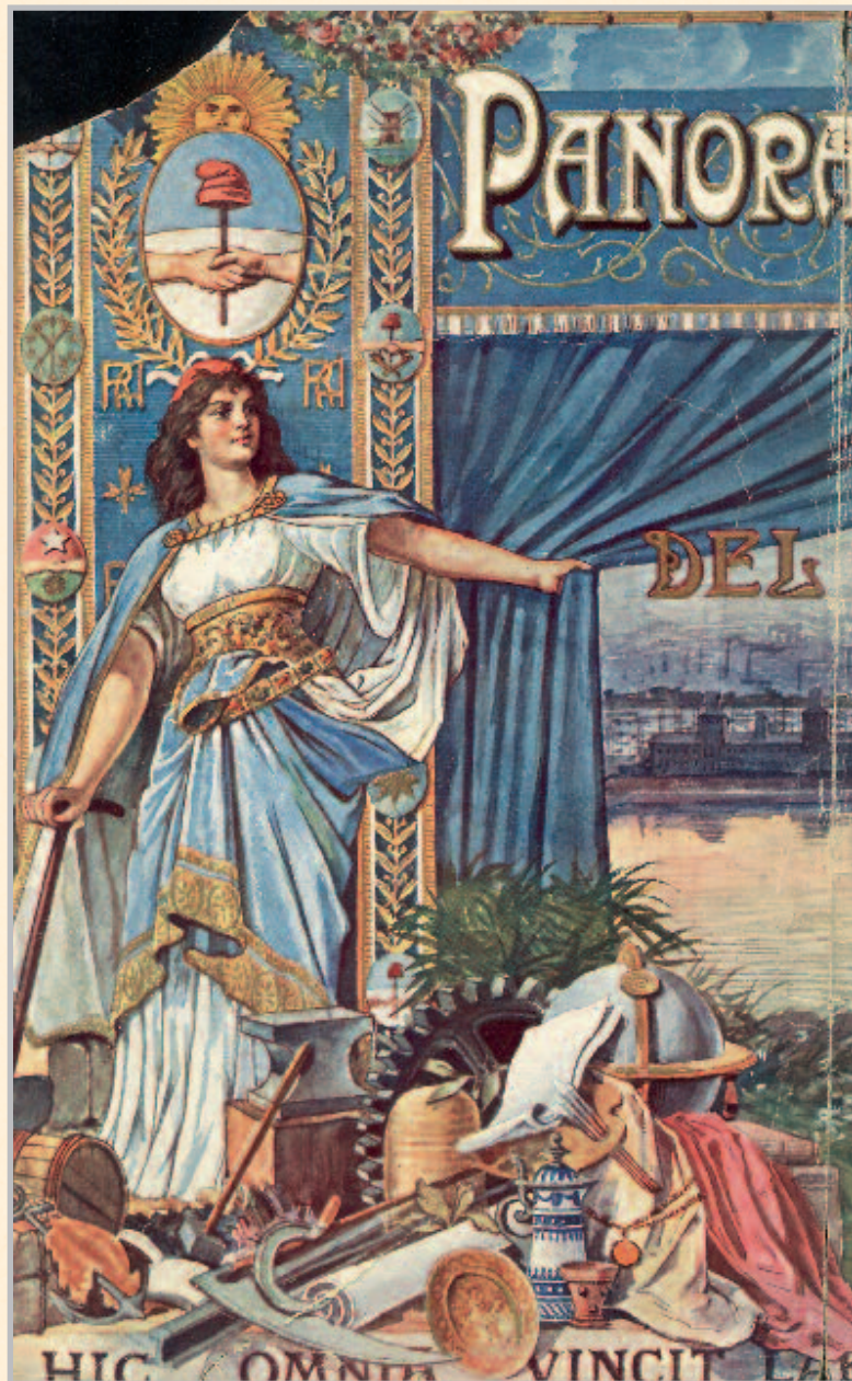
Gran Panorama Argentino editado en Buenos Aires en el 1º Centenario, 1910.