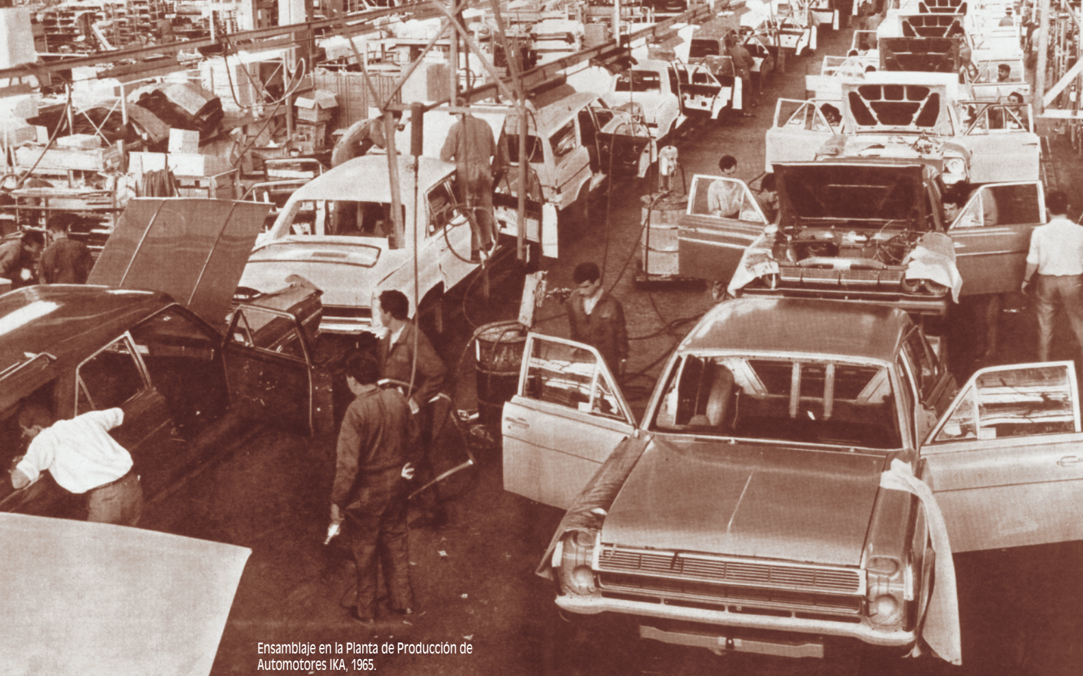
Ensamblaje en la Planta de Producción de Automotores IKA, 1965.